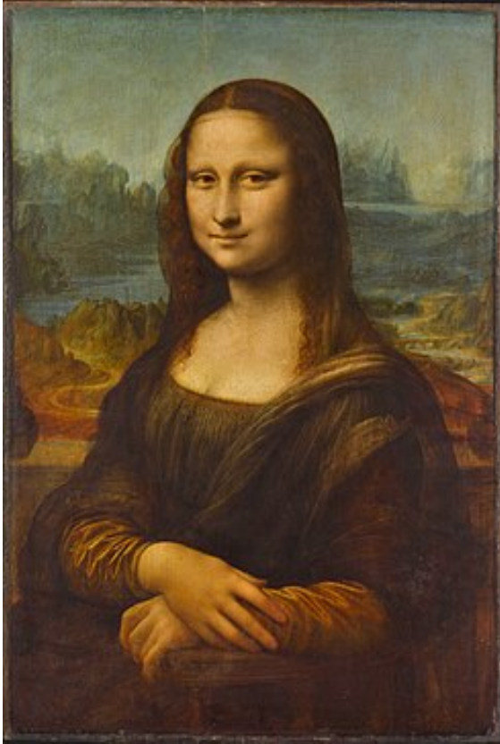
"La Gioconda o Monalisa" Leonardo da Vinci

Es nuestro órgano inteligente móvil, con capacidad de observación de todas las actividades nuestras, de todas nuestras inteligencias, e incluso de sí mismo. De él depende la óptima coordinación e integración de nuestras inteligencias. Por su naturaleza amorosa y noble, garantiza el ennoblecimiento de quienes la desarrollan.