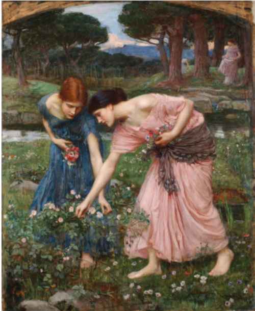
John William Waterhouse

La Inteligencia Emocional es de naturaleza cálida y vital. Su lenguaje son los sentimientos y emociones, tiende a la amistad de modo natural y cuando la utilizamos opera la siguiente ley: El sentimiento fija el conocimiento.