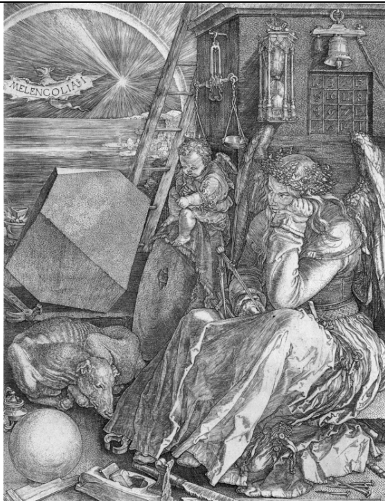
"El cuadro mágico"