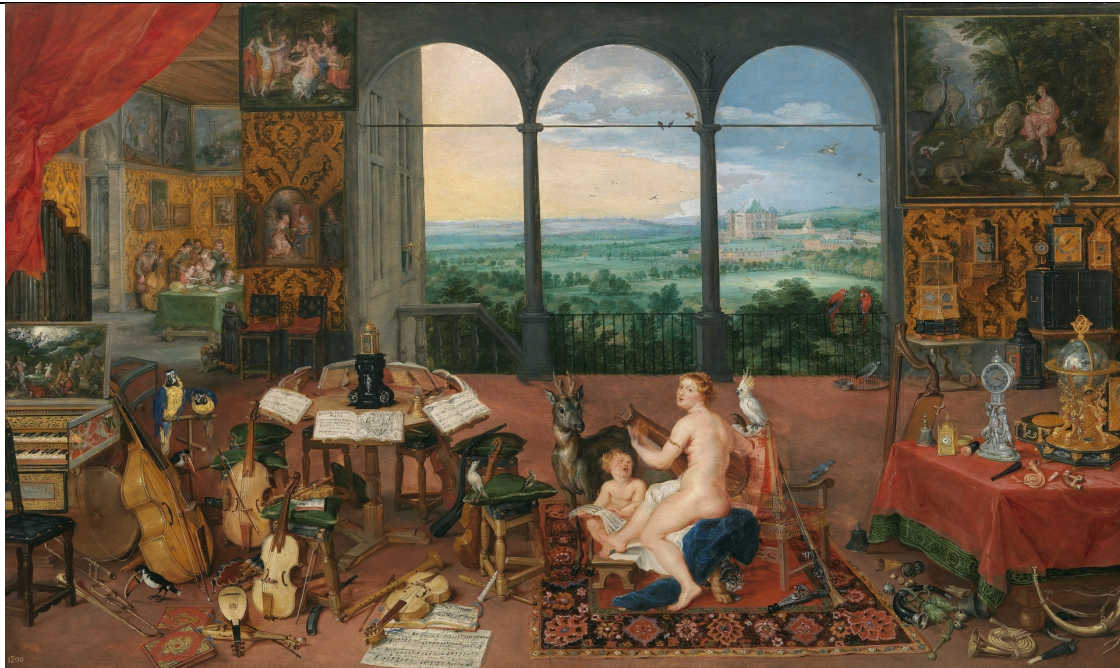
"Los cinco sentidos; El Oído" Brueghel el viejo y Paul Rubens

Es la verdadera Inteligencia Superior de la mente humana, es nuestra Inteligencia Espacial. Se puede definir como la facultad de tener procesos inteligentes sin palabras. Es de tendencia algo respetuosa, por lo tanto respeta la actividad intelectual, y mientras se produce, la mente superior entra poco en acción. Su desarrollo alcanza madurez cuando termina el crecimiento físico. Resulta algo errático en el adolescente.